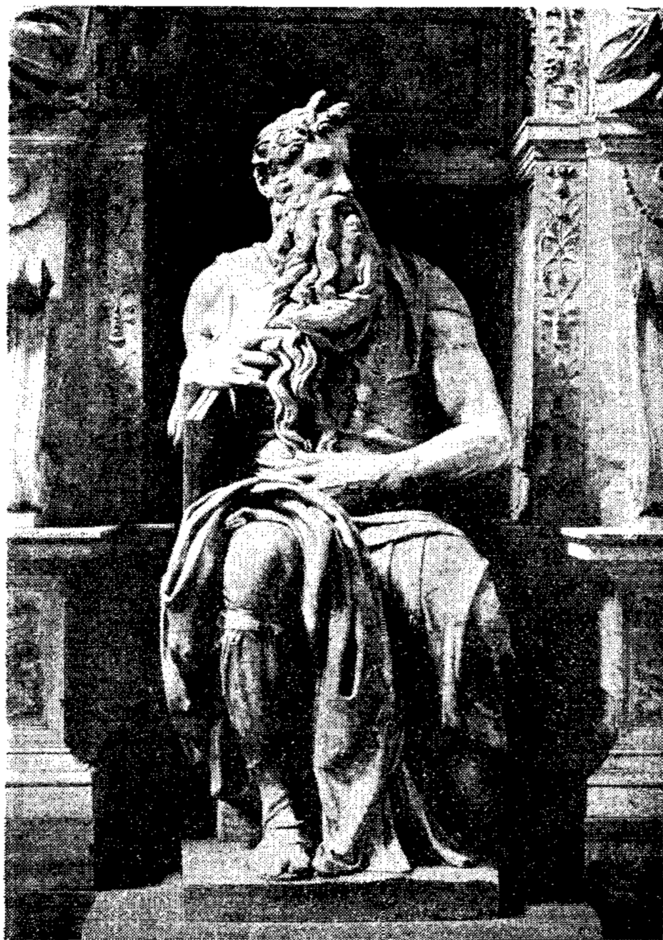
彼らモイゼの顔を見るに、その（天主との語らいより）出で来る時、角あり。（出三四・三五）